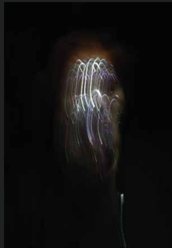
Stampa su plexiglass-Luce M 6 - 113x55 cm