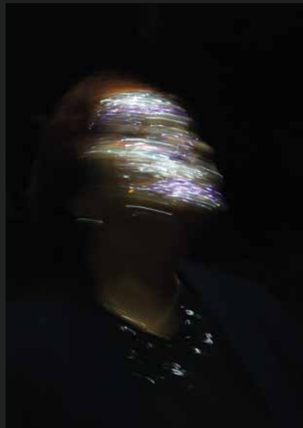
Stampa su plexiglass -Luce M 2 - 113x55 cm