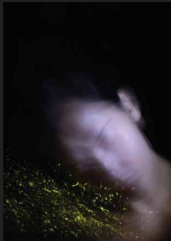
Lightbox - Luce B3 113 X 55 cm