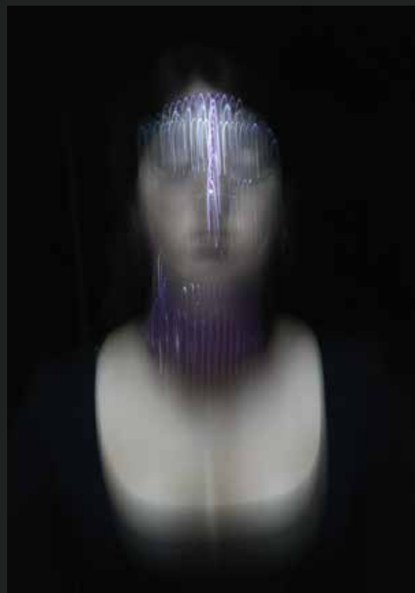
Stampa su plexiglass -Luce M 5 - 113x55 cm