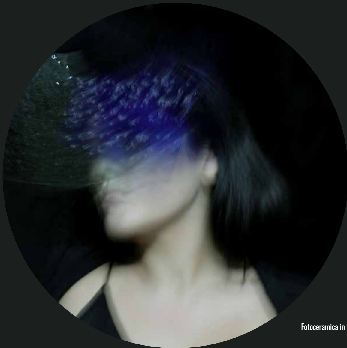
Fotoceramica in terzo fuoco - Luce C 1 - diametro 50 cm