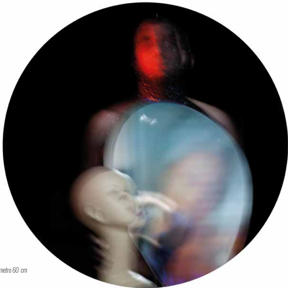
Stampa metal su pannello - Luce T 2 - diametro 60 cm