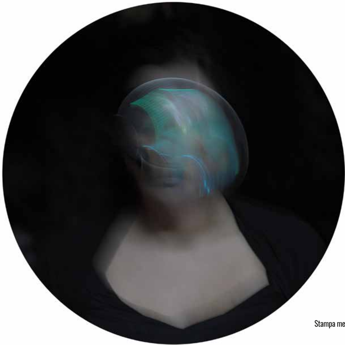
Stampa metal su pannello - Luce T 1 - diametro 60 cm