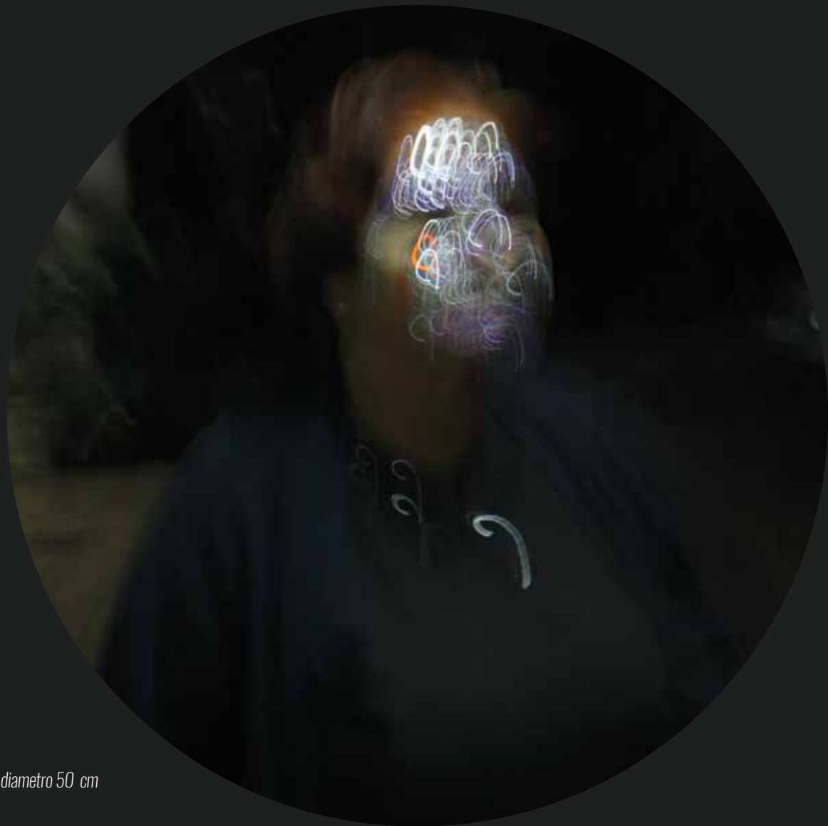
Fotoceramica in terzo fuoco - Luce C 2 - diametro 50 cm