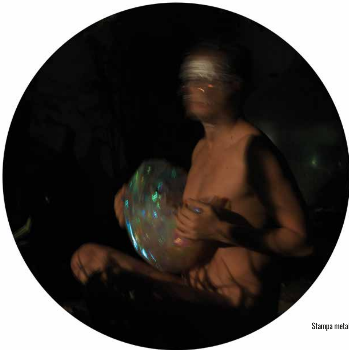
Stampa metal su pannello - Luce T 3 - diametro 60 cm