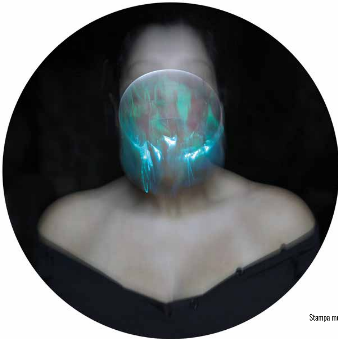
Stampa metal su pannello - Luce T 9 - diametro 60 cm