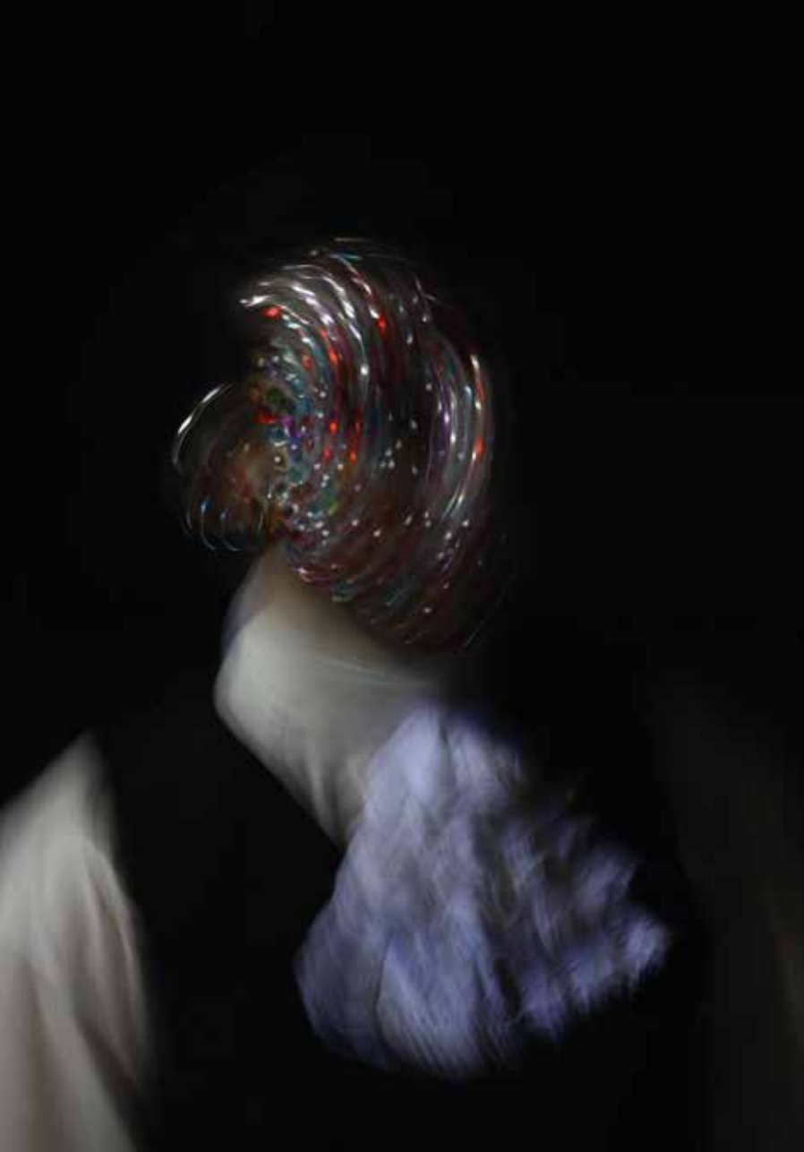
Lightbox - Luce B4 - 70x100 cm