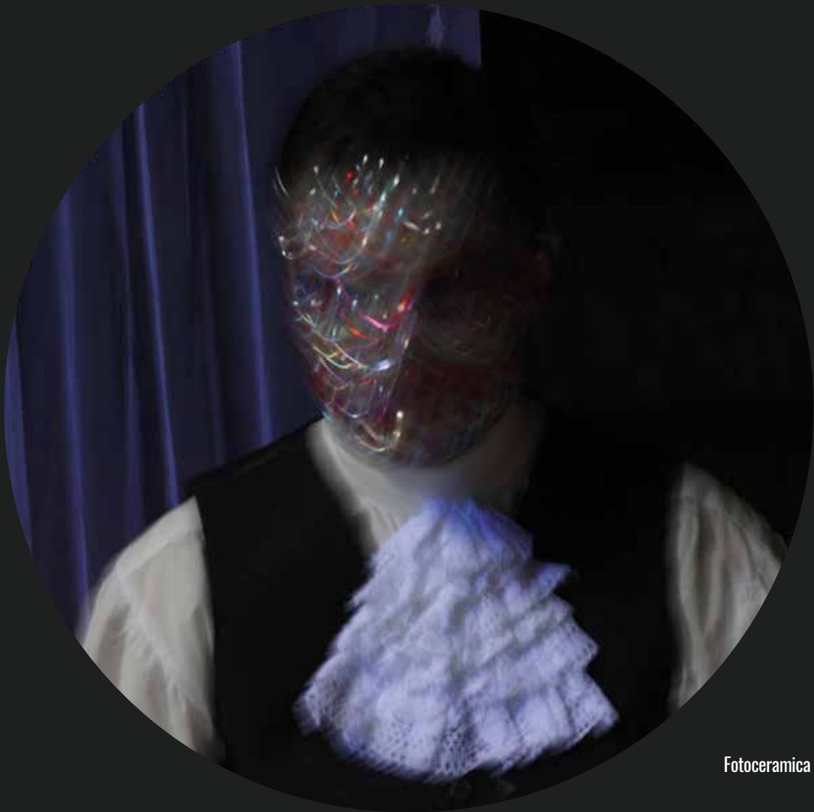
Fotoceramica in terzo fuoco - Luce C 3 - diametro 50 cm