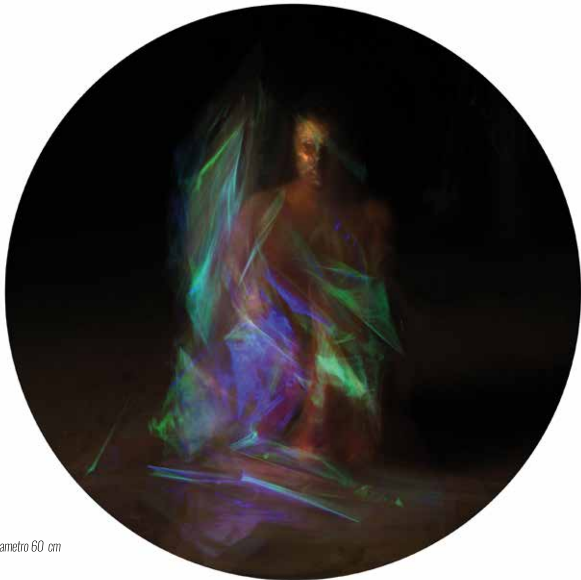
Stampa metal su pannello - Luce T 6 - diametro 60 cm