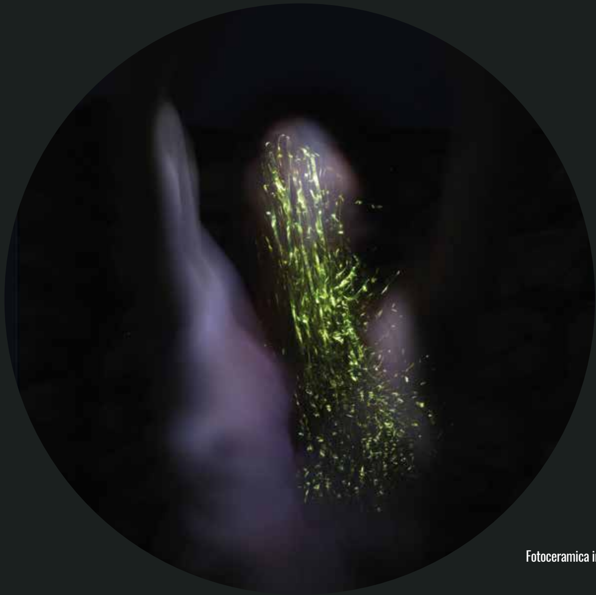
Fotoceramica in terzo fuoco - Luce C 9 - diametro 50 cm