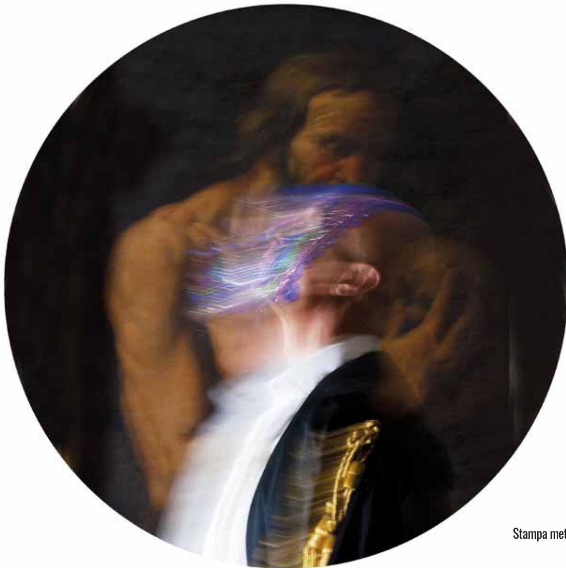
Stampa metal su pannello - Luce T 7 - diametro 60 cm