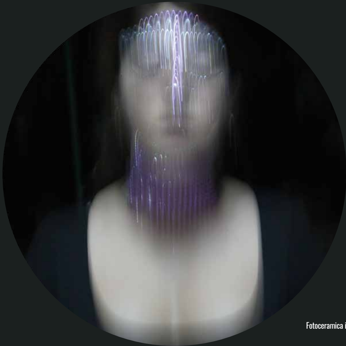
Fotoceramica in terzo fuoco - Luce C 5 - diametro 50 cm