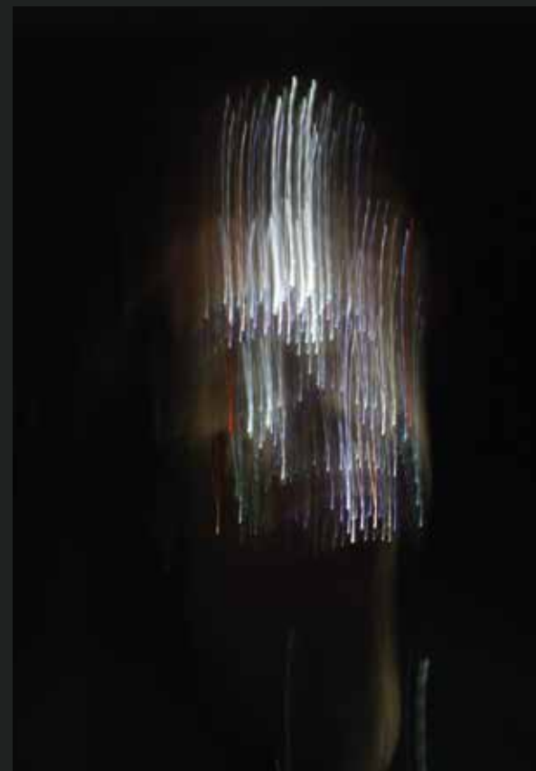
Stampa su plexiglass -Luce M 7 - 113x55 cm