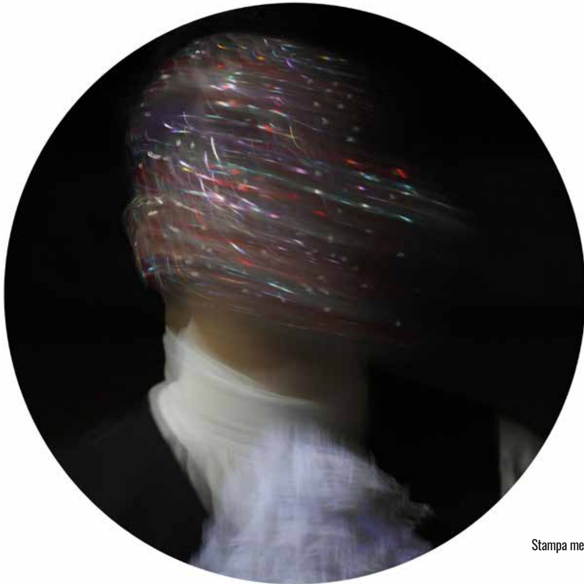
Stampa metal su pannello - Luce T 5 - diametro 60 cm