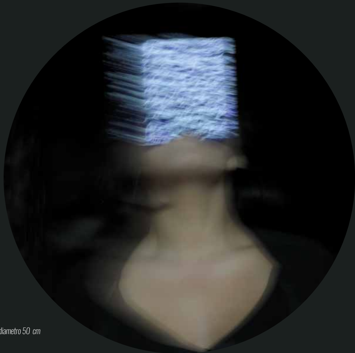
Fotoceramica in terzo fuoco - Luce C 8 - diametro 50 cm