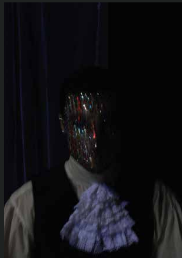
Stampa su plexiglass -Luce M 3 - 113x55 cm