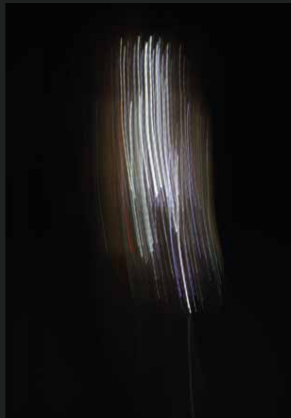
Stampa su plexiglass - Luce M 4 - 113x55 cm