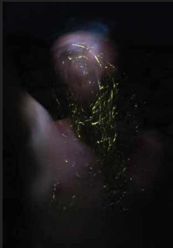
Lightbox - Luce B2 113 X 55 cm