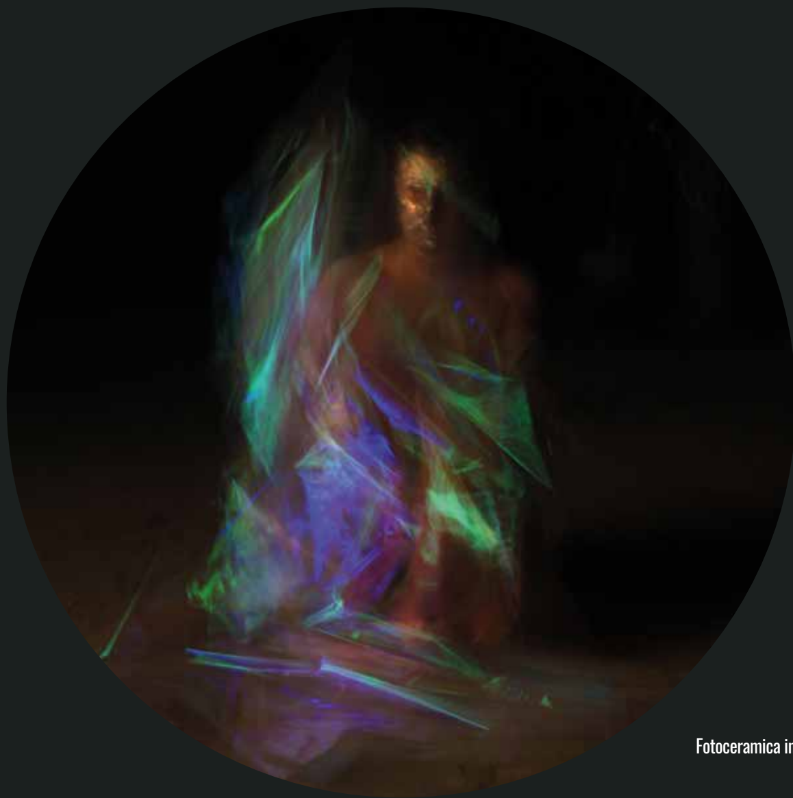
Fotoceramica in terzo fuoco- Luce C 11 - diametro 50 cm