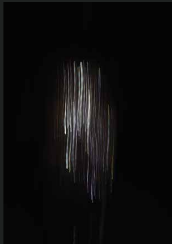
Stampa su plexiglass -Luce M 1 - 113x55 cm