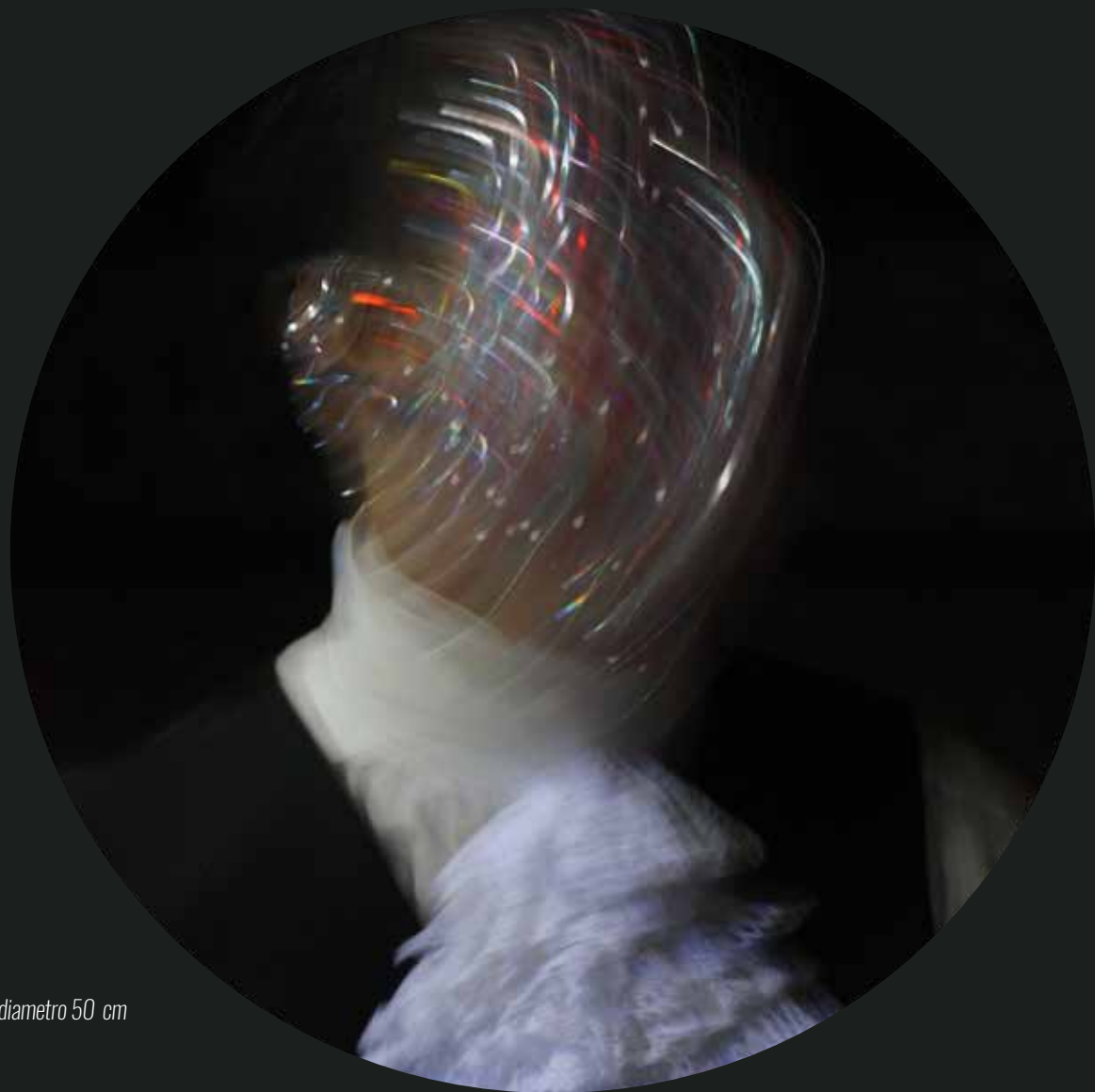
Fotoceramica in terzo fuoco - Luce C 4 - diametro 50 cm