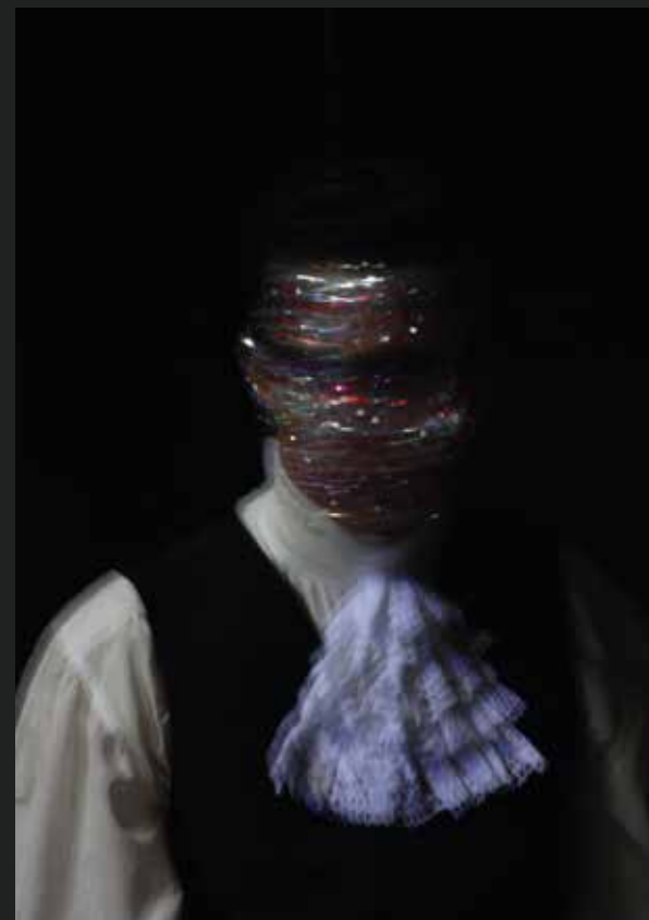
Stampa su plexiglass -Luce M 8 - 113x55 cm