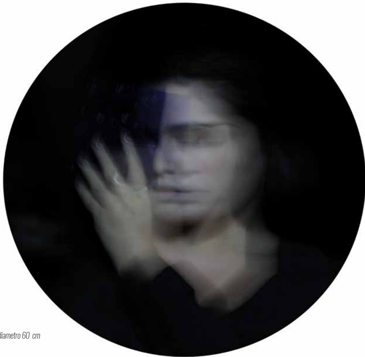
Stampa metal su pannello - Luce T 8 - diametro 60 cm