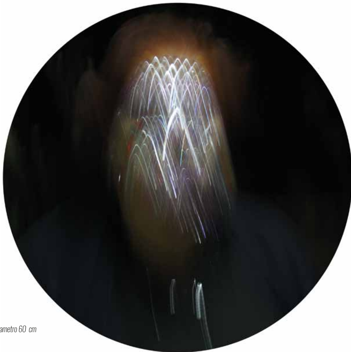
Stampa metal su pannello - Luce T 4 - diametro 60 cm