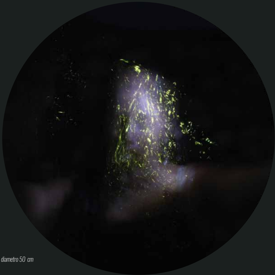
Fotoceramica in terzo fuoco - Luce C 10 - diametro 50 cm