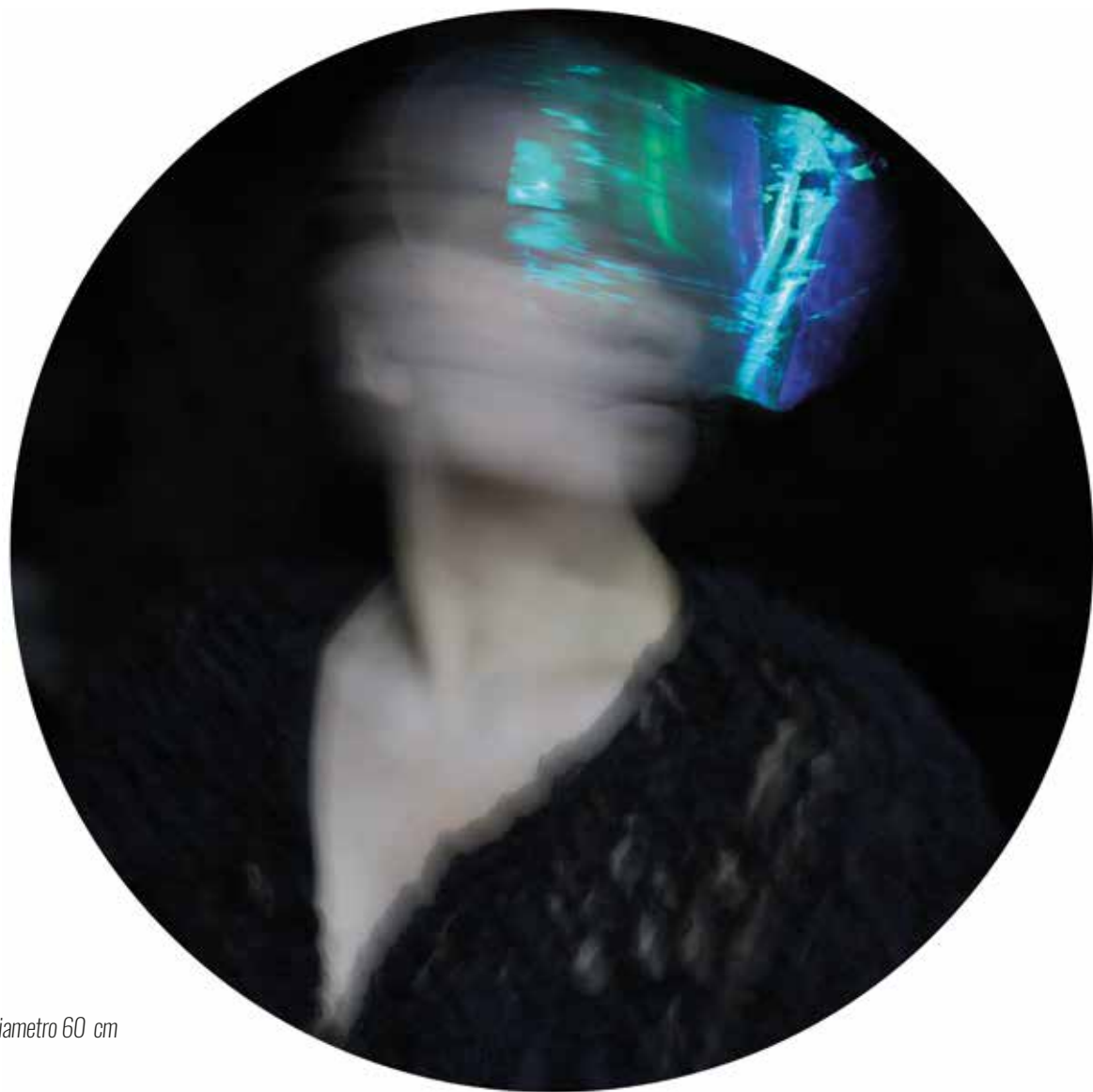
Stampa metal su pannello - Luce T 11 - diametro 60 cm