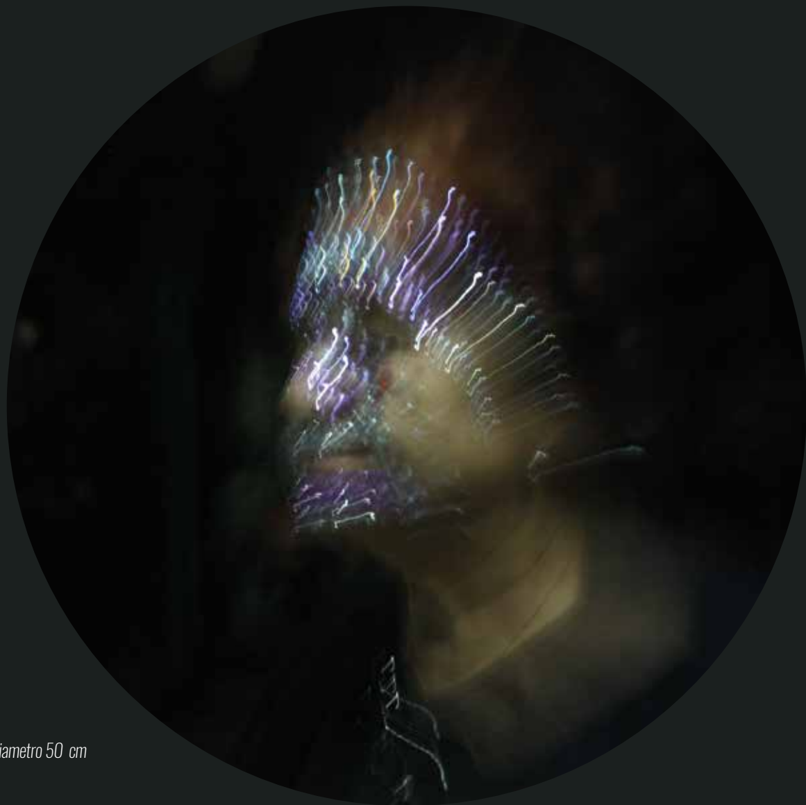
Fotoceramica in terzo fuoco- Luce C 6 - diametro 50 cm